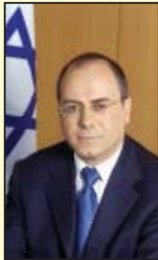
יקיר המלונאות השר יושע של

מלונאי ישראל מוקירים את פועלם של שלושה אישים שהטביעו את חותמם על תעשיית המלונאות, ומעניקים להם אותות כבוד: