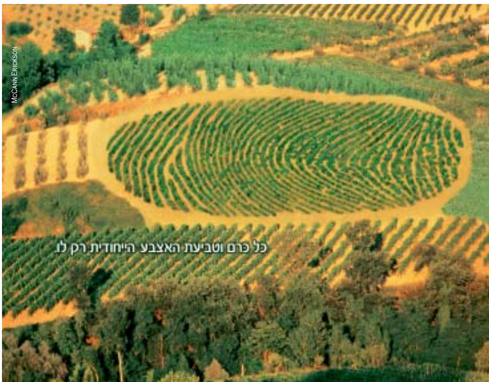
כל פרט וטביעת האצבע הייחודית רק לו.

פריזת מסכים במוקד ההזמנות של Hertz 1-700-507-555 או פנה למוקד הנסיעות שלך