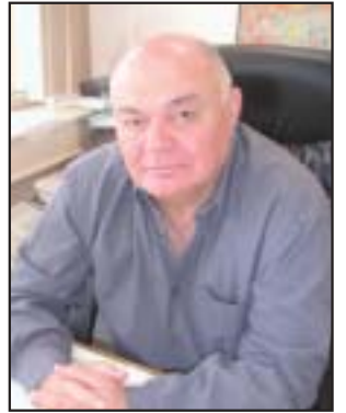
יחסי עבודה ושכר

ועדת העבודה פועלת לקיומם של יחסי עבודה תקינים, שמירה על שקט תעשייתי ומתמקדת בניהול מו"מ וחתמה על הסכמי עבודה קיבוציים על פי הצורך.